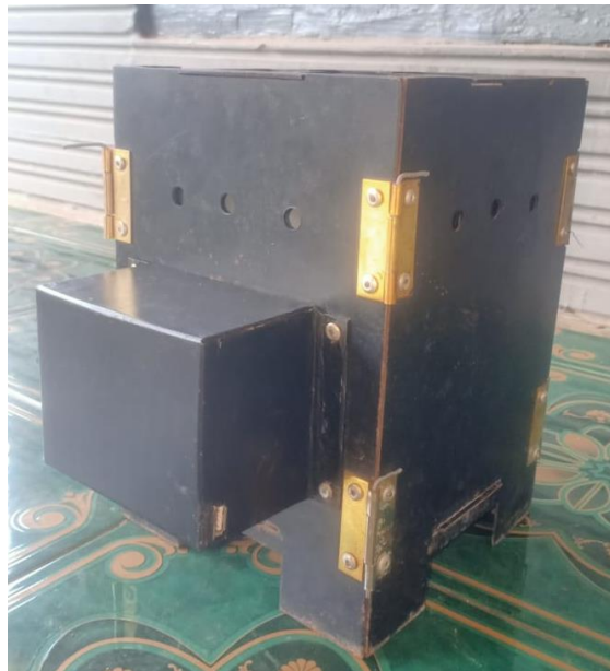
Gambar 4. Uji Coba Smart Stove

Uji Coba Smart Stove saat kondisi siang hari, percobaan panel surya berhasil. Hal ini dapat dibuktikan dengan adanya daya listrik. Dijelaskan pada Gambar 4 diatas.