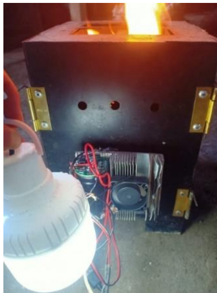
Gambar 3. Uji Coba Smart Stove

Berikut ini adalah hasil dari desain alat. Pada Gambar 3 merupakan uji coba smart stove menggunakan biomassa kayu berhasil terbakar di atas kompor dan hasil pembakaran biomassa berhasil menyakan lampu LED 5 watt